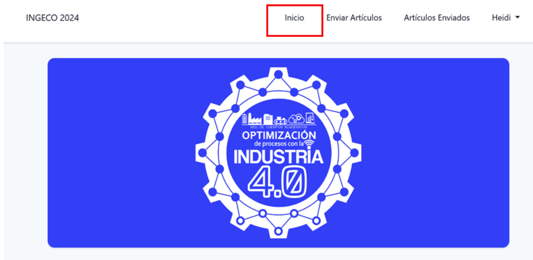
Figura 6 Pantalla de inicio del sistema

En la parte superior de la pantalla, encontrarás la barra de navegación, la cual te permite acceder a diferentes secciones de la plataforma.