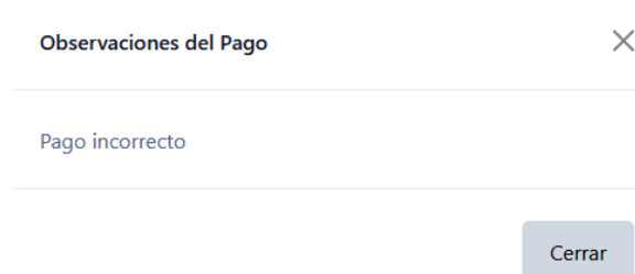
Figura 15 Observaciones del pago

Se muestra una pantalla emergente con las observaciones al presionar el botón "Observaciones del pago".