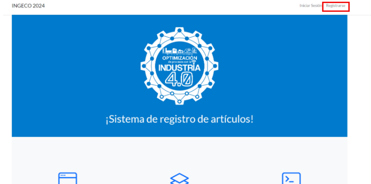
Figura 1 Inicio

Haz clic en el botón "Registrarse", ubicado en la esquina superior derecha de la página de inicio.