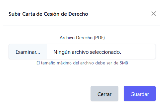
Figura 13 Subir archivo de derecho

Se muestra una pantalla emergente para subir la carta de cesión de derechos al presionar el botón "Subir Carta de Cesión de Derecho".